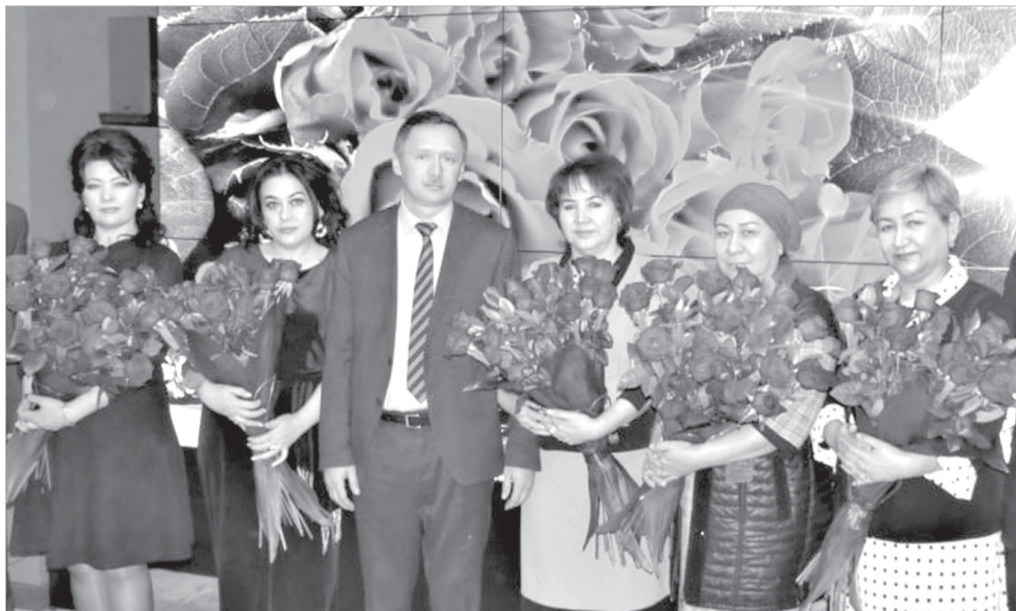
Жидаги эгаллаган муносиб ўрнидан далолатдир.

Бугунги кунда хотин-қизларимиз олий таълим олиб, турли соҳалардаги мутахассисликларни эгаллаб халқ хўжалигининг барча жабхаларида эркаклар билан елкама-елка туриб меҳнат қилмоқдалар. Айни вақтда хотин-қизларнинг улуши соғлиқни сақлаш ва ижтимоий хизматлар соҳасида 82 фоизни, илм-фан, таълим-тарбия, маданият ва санъат соҳаларида 72 фоизни, саноятда 38 фоизни, тадбиркорликда 35 фоизни, олий таълимда 46 фоизни ташкил этиши ҳам уларнинг соҳалар ривожланишига алоқадорлиги аниқланади.